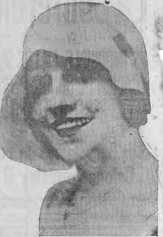
LA ENCANTADORA PRIMERA TIPLE MATILDE PALOU